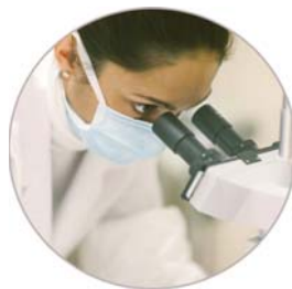
定制生物活性检测